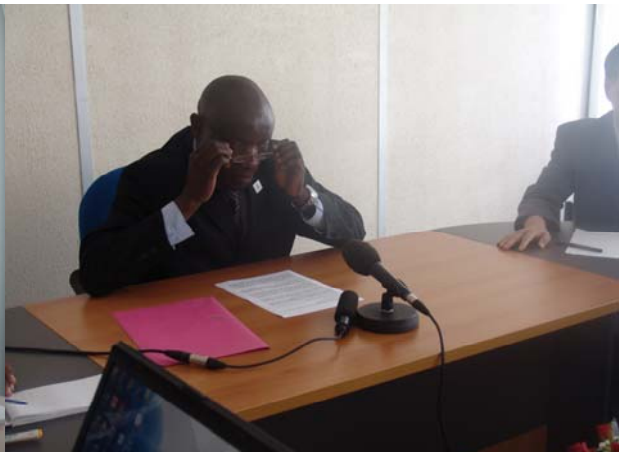
Mr Chiley démarre la cérémonie avec son discours