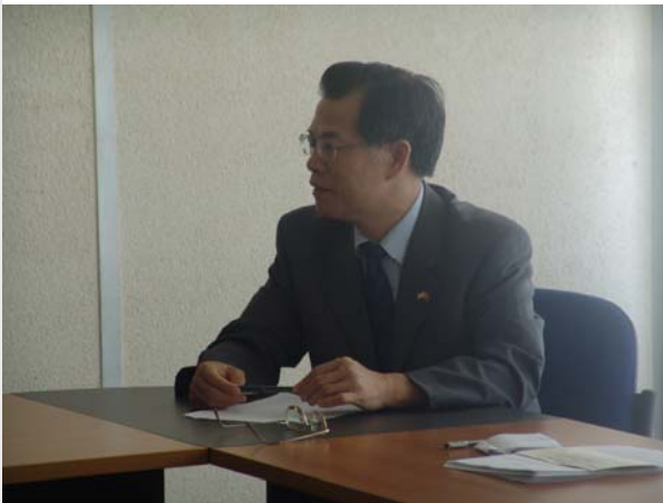
Mr l' Ambassadeur de Chine est très attentif