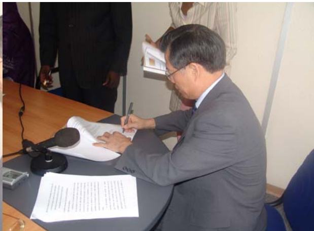
Monsieur l'Ambassadeur à son tour signe le Protocole d'Accord