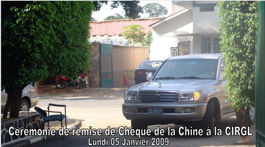
Cérémonie de remise de Chèque de la Chine à la CIRGL Lundi 05 Janvier 2009