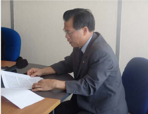
C'est au tour de l'Ambassadeur de Chine de prendre la parole