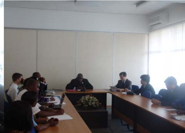
Dans la salle de conférence tout le monde est prêt pour le discours