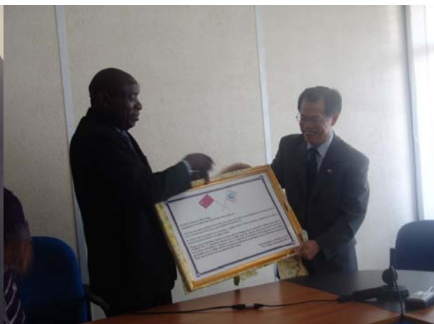
Remerciement de la Chine en l'endroit de la CIRGL