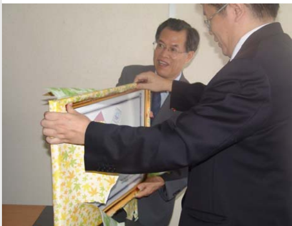
Monsieur l'Ambassadeur découvre son cadeau