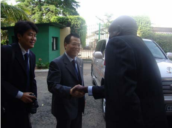
L' Ambassadeur de Chine est reçu par le Secrétaire Exécutif Adjoint de la CIRGL