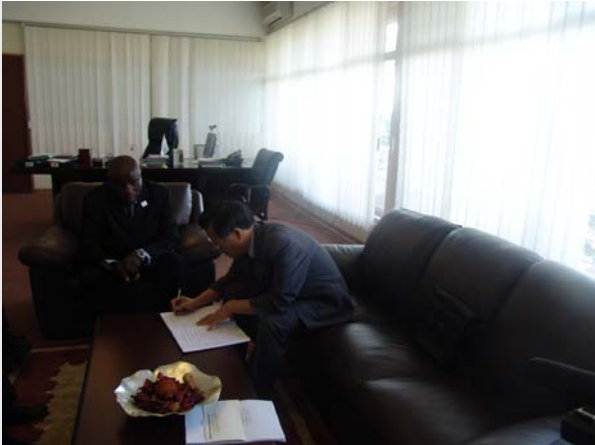
C'est la signature du Livre d'Or