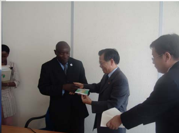
Le diplomate chinois remet le chèque de USD$ 100 000 au fonctionnaire de la CIRGL